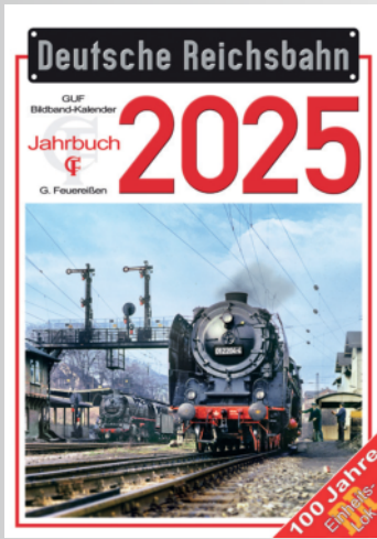
DR-Kalender 2025 DR calendar 2025 (Feuerreißer Verlag)