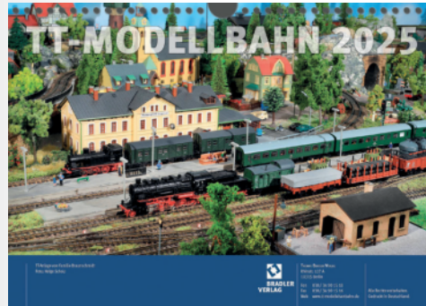
TT-Kalender 2025 TT calendar 2025 (Bradler Verlag)